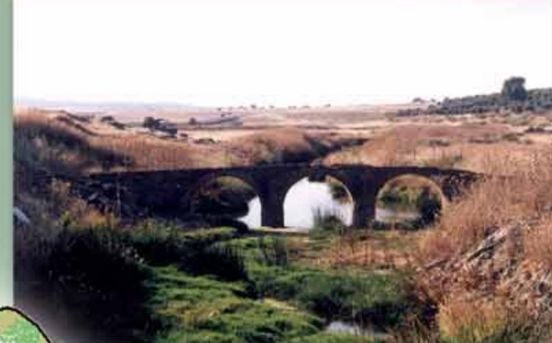
Puente medieval del Rio Tirteafuera. Tirteafuera (Almódovar del Campo).