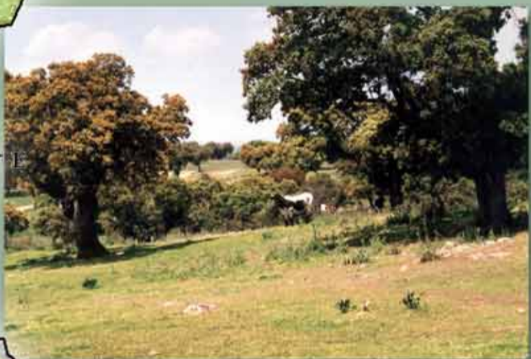
Estampa adhesada del Valle de Alcudia.