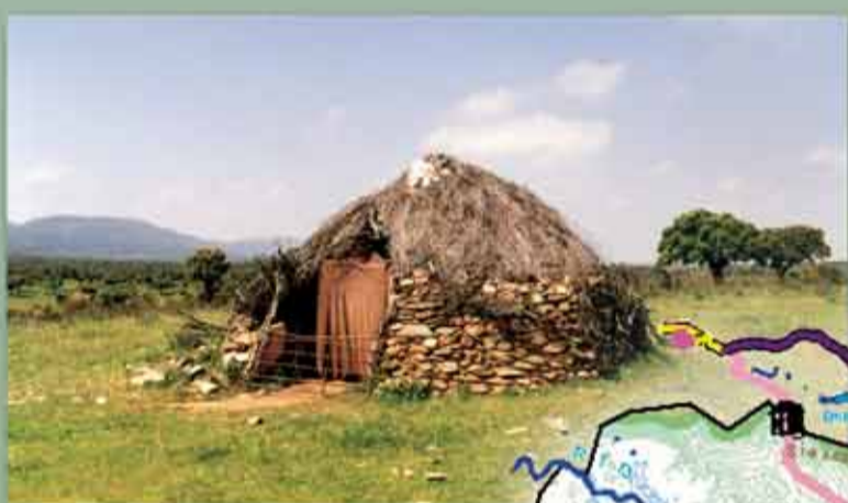
Chozo de pastores con base de mampostería.