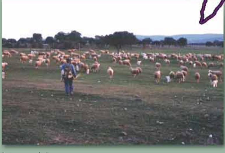
Pastor con su rebaño.