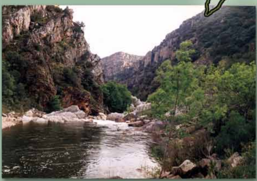
Hoz del Jándula.