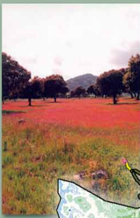
Patrimonio Natural de Brazaortas.