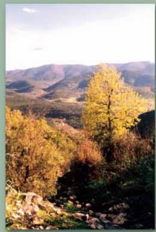
Patrimonio Natural Cabezarribas.